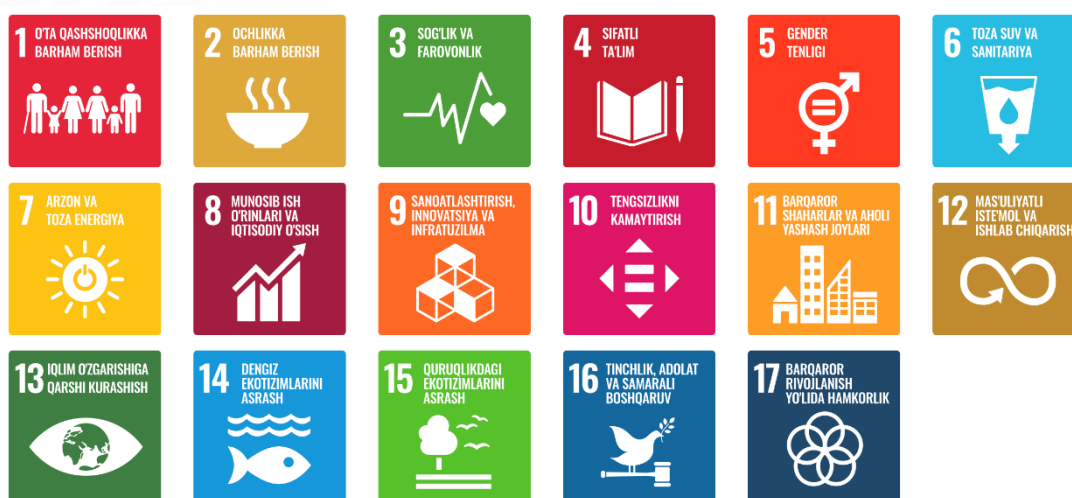
1 – rasm. BMTning barqaror rivojlanish maqsadlari

17-maqсад: Barqaror rivojlanish yo'lida hamkorlik.